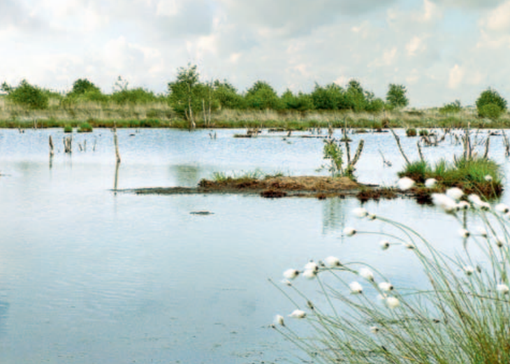
Kleine eilanden in het stille water kunnen als plekken voor nesten dienen.